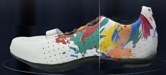
Scanned data by EinScan HX2 & Texture Mapper Lite