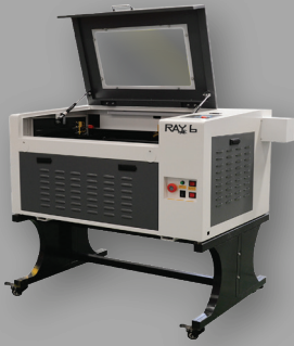
▶ RAY6 Smart CO 2 Laser

เครื่องเดียวที่ตัดได้ทั้ง โลหะ, อลูมิเนียม