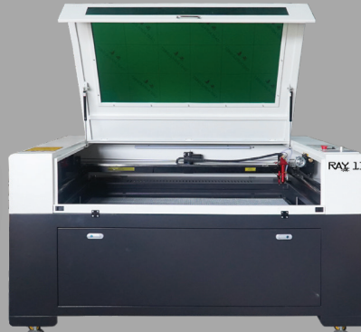
▶ RAY13 Smart CO 2 Laser