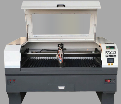
▶ RAY13 Metal Smart CO 2 Laser