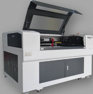
▶ RAY9 Smart CO 2 Laser