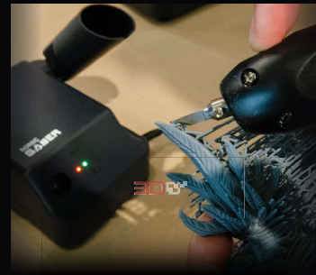
การสั่นของใบมีด 40,000 ครั้งต่อวินาที