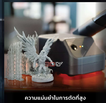
ความแม่นยำในการตัดที่สูง