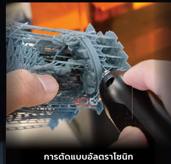
การตัดแบบอัลตราโซนิค

นอกจากการตัดซัพพอร์ตแล้วยังสามารถตกแต่งโมเดลของเรา ให้มีความแม่นยำขึ้น เนื่องจากบางครั้ง ขนาดที่เราออกแบบมาอาจจะทำให้การต่อโมเดล ในแต่ละส่วนไม่เท่ากัน ทำให้จำเป็นต้องมีการตัด หรือกรัดออกของโมเดล ซึ่ง SONIC SABER มีความแม่นยำในการตัดที่สูงที่ให้ตอบโจทย์ของงานได้อย่างดี